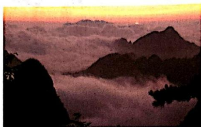
图 1-1 泰山云海