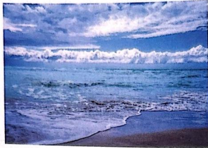
图 1-5 大海与云