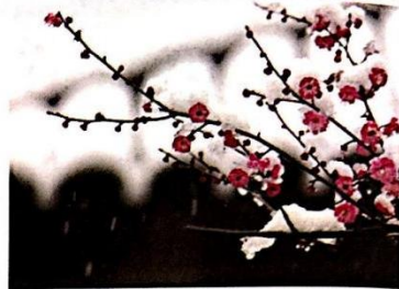
图 1-2 雪中寒梅