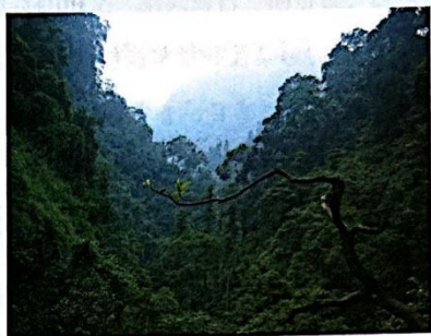
图 1-4 峨眉山近景